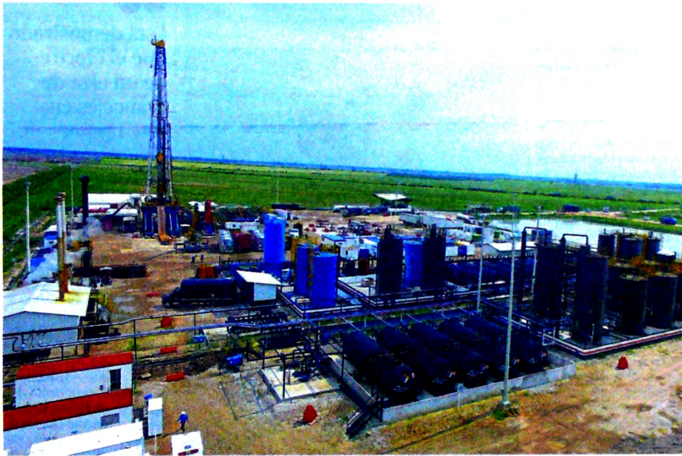
El programa de trabajo incluye 32 pozos de desarrollo y avanzada, y dos de exploración en el bloque LLA34.

Y no conforme con la primera adjudicación, y en línea con su estrategia de fortalecer su operación en el país, logró en noviembre del 2019, y en asocio con Hocol, dos contratos más LLA-123 y LLA-124 para el mismo fin en la segunda subasta del PPAA.