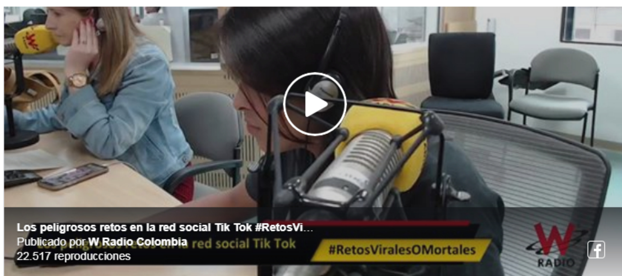
Los peligrosos retos en la red social Tik Tok #RetosViralesOMortales Publicado por W Radio Colombia red social Tik Tok 22.517 reproducciones

Sigue La W | 07/02/2020 - (hace 2 horas)