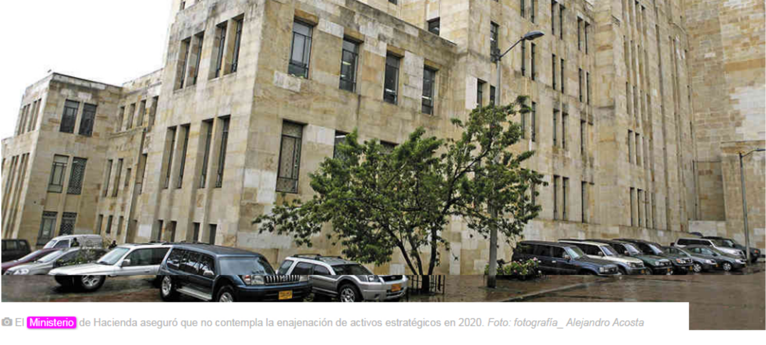
El Ministerio de Hacienda aseguró que no contempla la enajenación de activos estratégicos en 2020. Foto: fotografía_Alejandro Acosta

El Gobierno logró cerrar financieramente 2019 sin necesidad de enajenar activos, esto gracias a ingresos no previstos y a un buen comportamiento en el recaudo. ¿Correrá con la misma suerte en 2020?