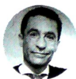
Ignacio Gaitán Presidente de iNNpulsa

“La gran noticia es el compromiso de los excombatientes. Usted no alcanza a imaginarse la transformación de esas personas involucradas en el negocio, dándoles educación, mirando los temas finan-