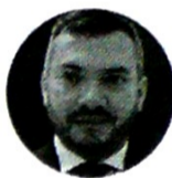
Andrés Stapper Director de la ARN

“Es evidente el compromiso para la reintegración de todos estos colombianos que han creído de manera honesta y han dado su voto de confianza”.