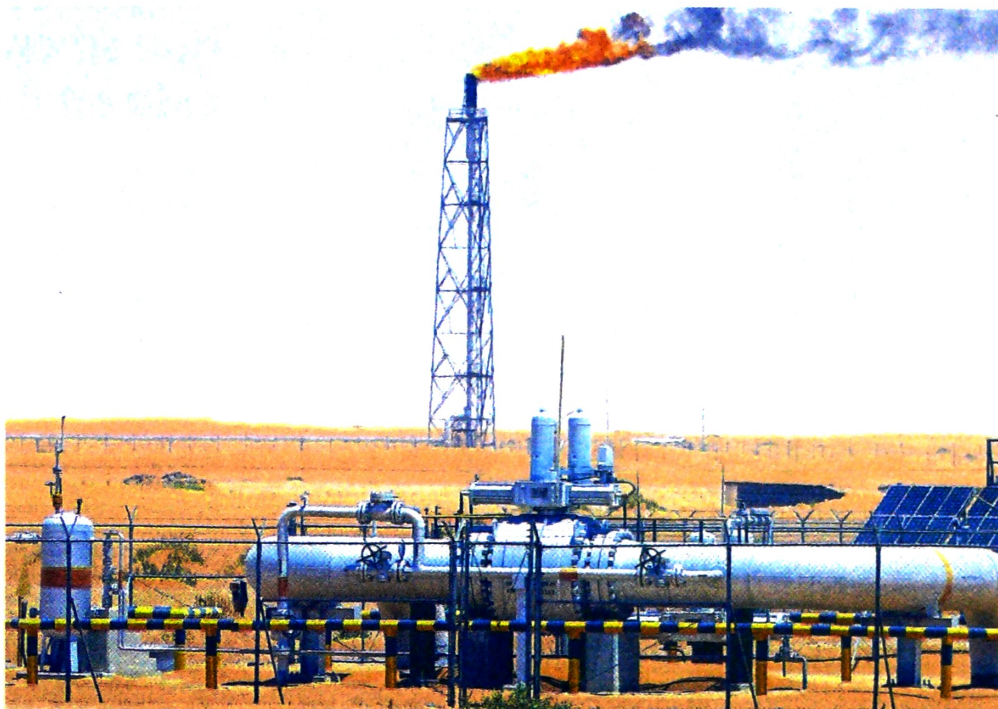
El 78% de las inversiones en producción se destinarán a proyectos en Colombia y el remanente en EE. UU., México y Brasil.

Pero, además, Ecopetrol tiene previsto continuar la