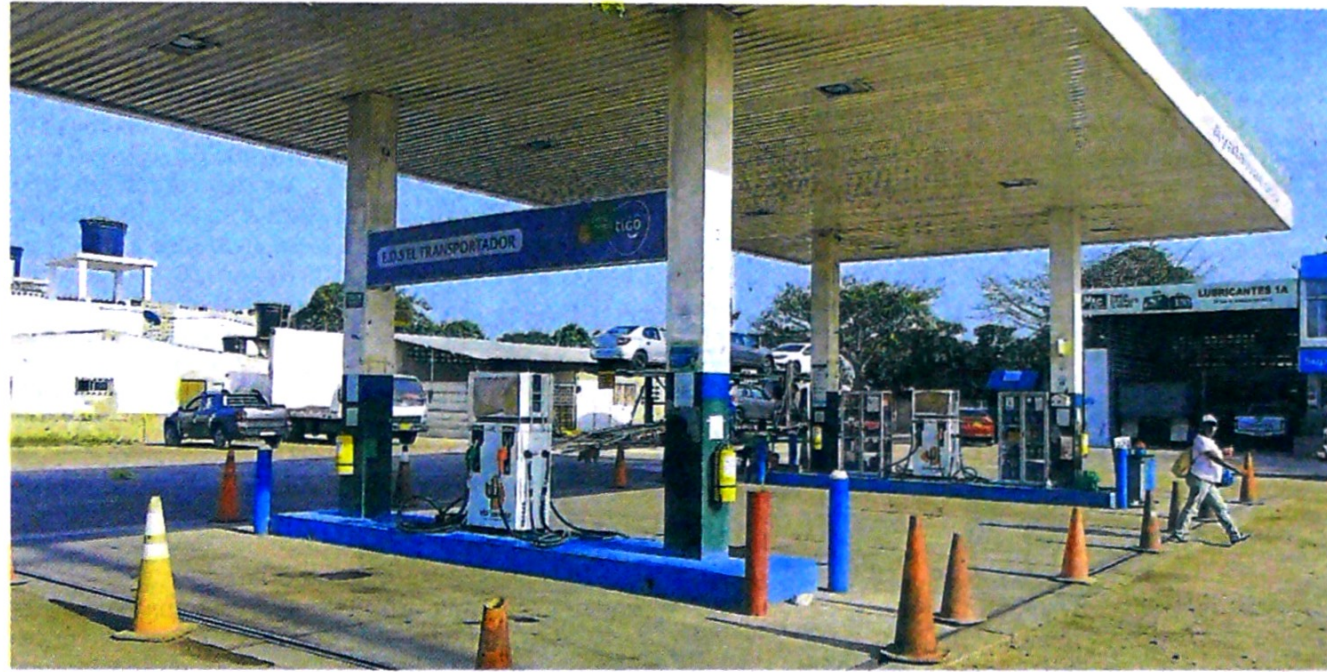
Todas las 194 estaciones de gasolina de La Guajira permanecen cerradas debido al paro de los comercializadores.

El cupo de combustibles subsidiados a La Guajira en el año 2014, fue de