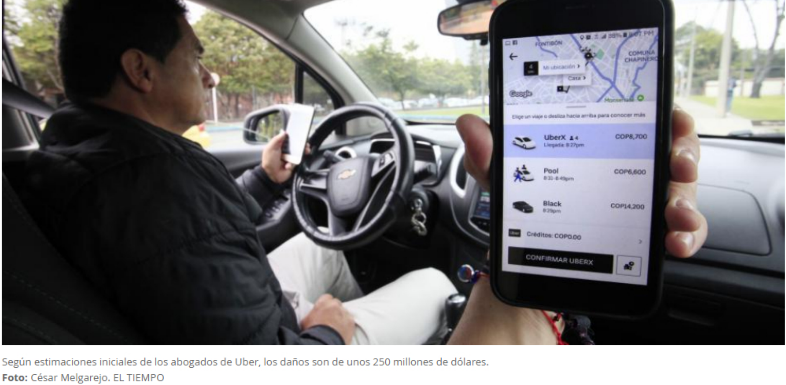
Según estimaciones iniciales de los abogados de Uber, los daños son de unos 250 millones de dólares.

RELACIONADOS: TLC DE COLOMBIA CON ESTADOS UNIDOS | TLC | UBER | SUPERSOCIEDADES | SIC