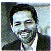
CARLOS ZENTENO PRESIDENTE DE CLARO COLOMBIA

"LA NUEVA LEY DE TELECOMUNICACIONES FAVORECERÁ LA LIBRE COMPETENCIA, Y LAS INVERSIONES A LARGO PLAZO".