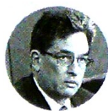
Alberto Carrasquilla Ministro de Hacienda

Pero aunque las proyecciones se modificaron a la baja, algunos expertos continúan pensando que los cálculos del Gobierno siguen siendo demasiado optimistas, teniendo en cuenta, sobre todo, el escenario internacional. "Nosotros pensa-