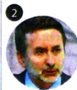
Josu Jon Imaz