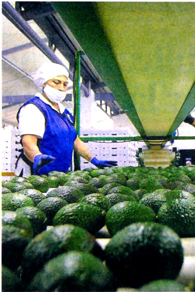
El dólar caro beneficia a los exportadores colombianos.

los mercados internacionales. Por ejemplo, los cafeteros han logrado sostener el precio interno del grano en alrededor de 850.000 pesos la carga de 125 kilos, gracias al repunte del dólar, ya que la cotización en la Bolsa Nueva York está regresando a niveles de un dólar la libra.