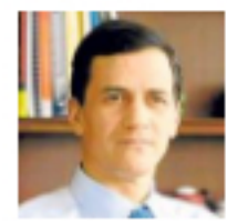
Columna de Rafael Nieto Loaiza

Hay quienes sostienen que el gobierno no puede solicitar a Maduro la extradición de Aída Merlano porque sería legitimar el régimen chavista. Lo de Maduro es una dictadura y Colombia no debe tener relaciones con esos gobiernos, dicen. Pero hay que ser coherentes. Y lo cierto es que Colombia tienen relaciones diplomáticas y comerciales con regímenes autoritarios como, por ejemplo, Cuba, Nicaragua y China. Y nadie pide romper relaciones con esos estados.