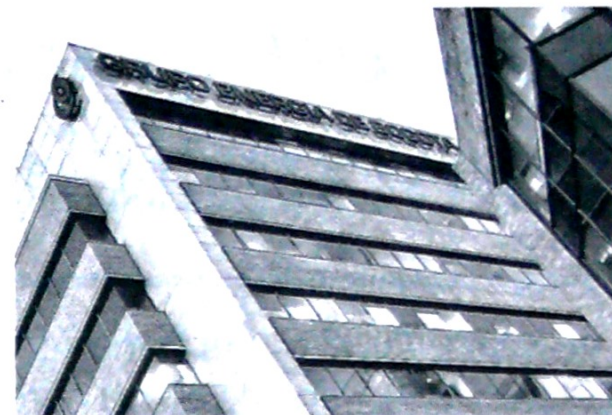
La nueva Junta Directiva tendrá vigencia por dos años. CEET

7 POR CIENTO fue el incremento reportado en el 2019 por el Ministerio de Minas y Energía en el total de pozos exploratorios en la operación petrolera al pasar de 791 en el 2018 a 846.