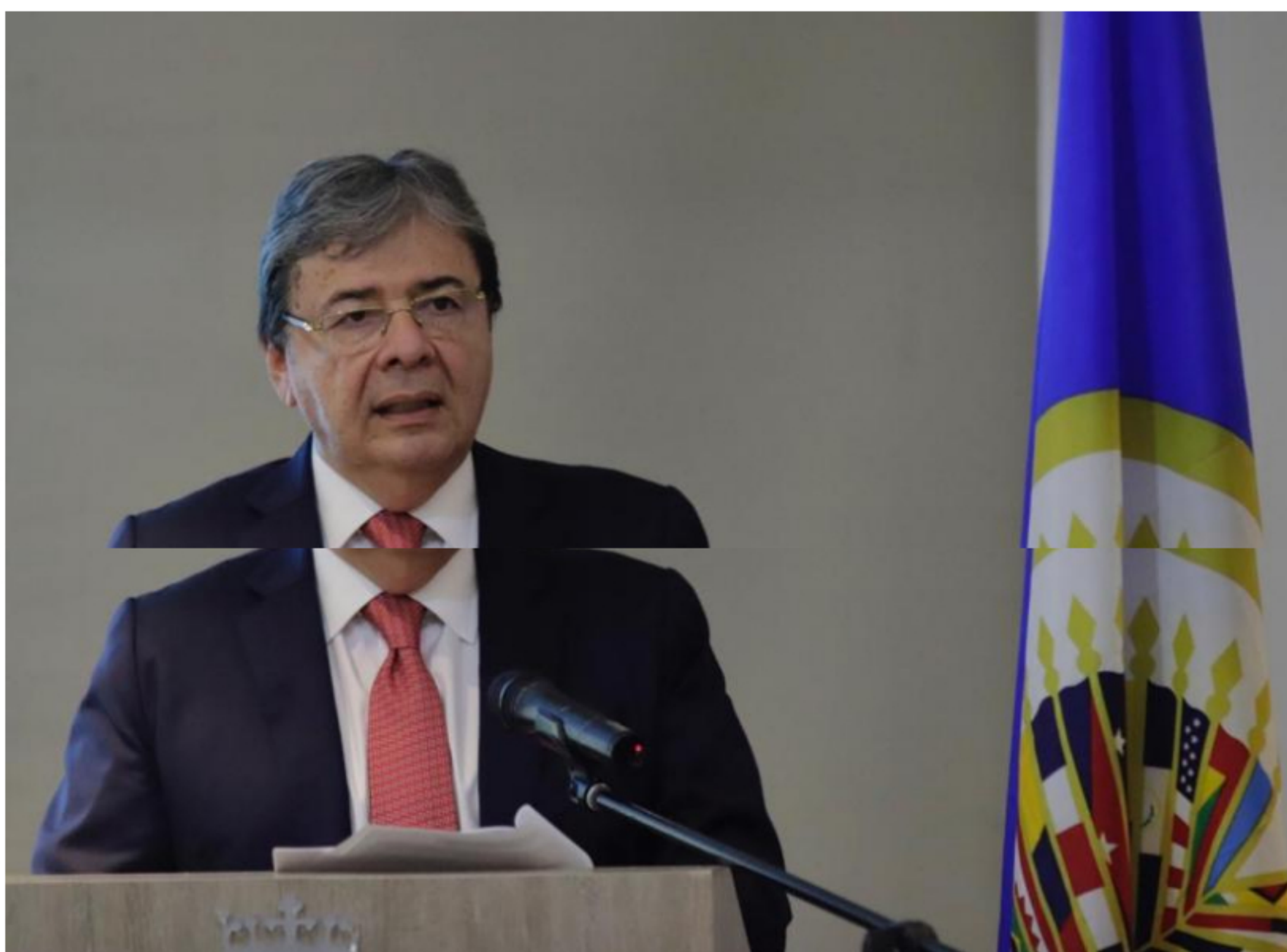
Carlos Holmes Trujillo

El ministro de Defensa Carlos Holmes Trujillo presidió un consejo de seguridad en la capital del departamento de Arauca, acompañado del gobernador José Facundo Castillo, los alcaldes de los siete municipios y la fuerza pública, tras el incremento de las acciones violentas en esa región del país.