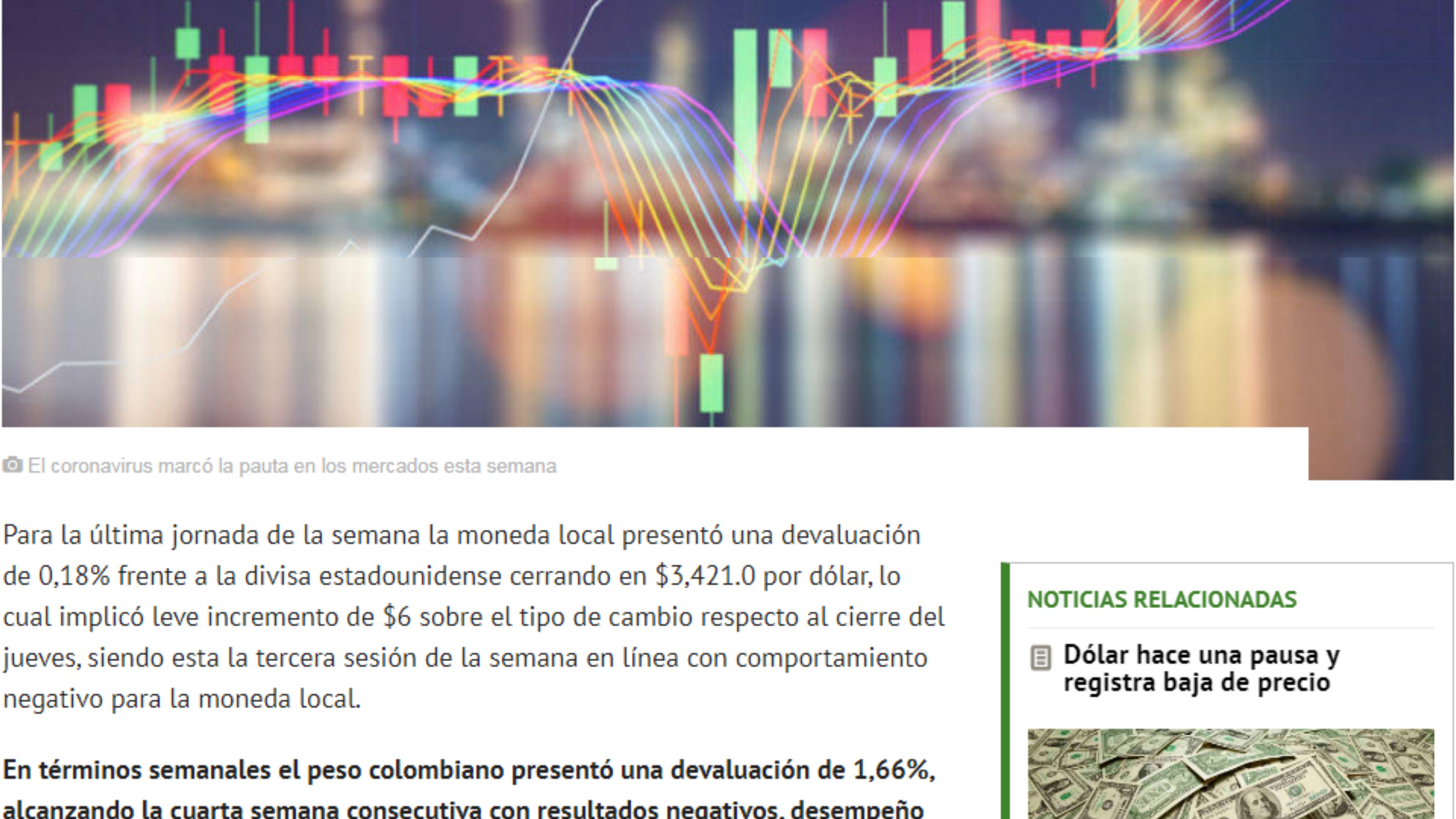
El coronavirus marcó la pauta en los mercados esta semana

Mientras que el dólar subió de precio en Colombia, las acciones en el mundo mantuvieron un comportamiento errático por cuenta de los anuncios sobre el impacto del virus que fue declarado emergencia sanitaria mundial por la OMS. Informe semanal de Casa de Bolsa.