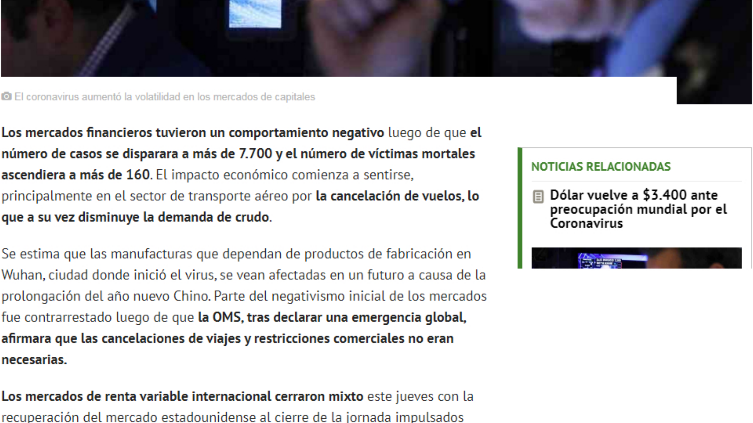
El coronavirus aumentó la volatilidad en los mercados de capitales

Los temores sobre la propagación del Coronavirus han explicado la volatilidad en los mercados durante la semana. El Grupo Bancolombia espera que la moneda continúe presionada en los próximos días y se cotice por encima de $3.400.