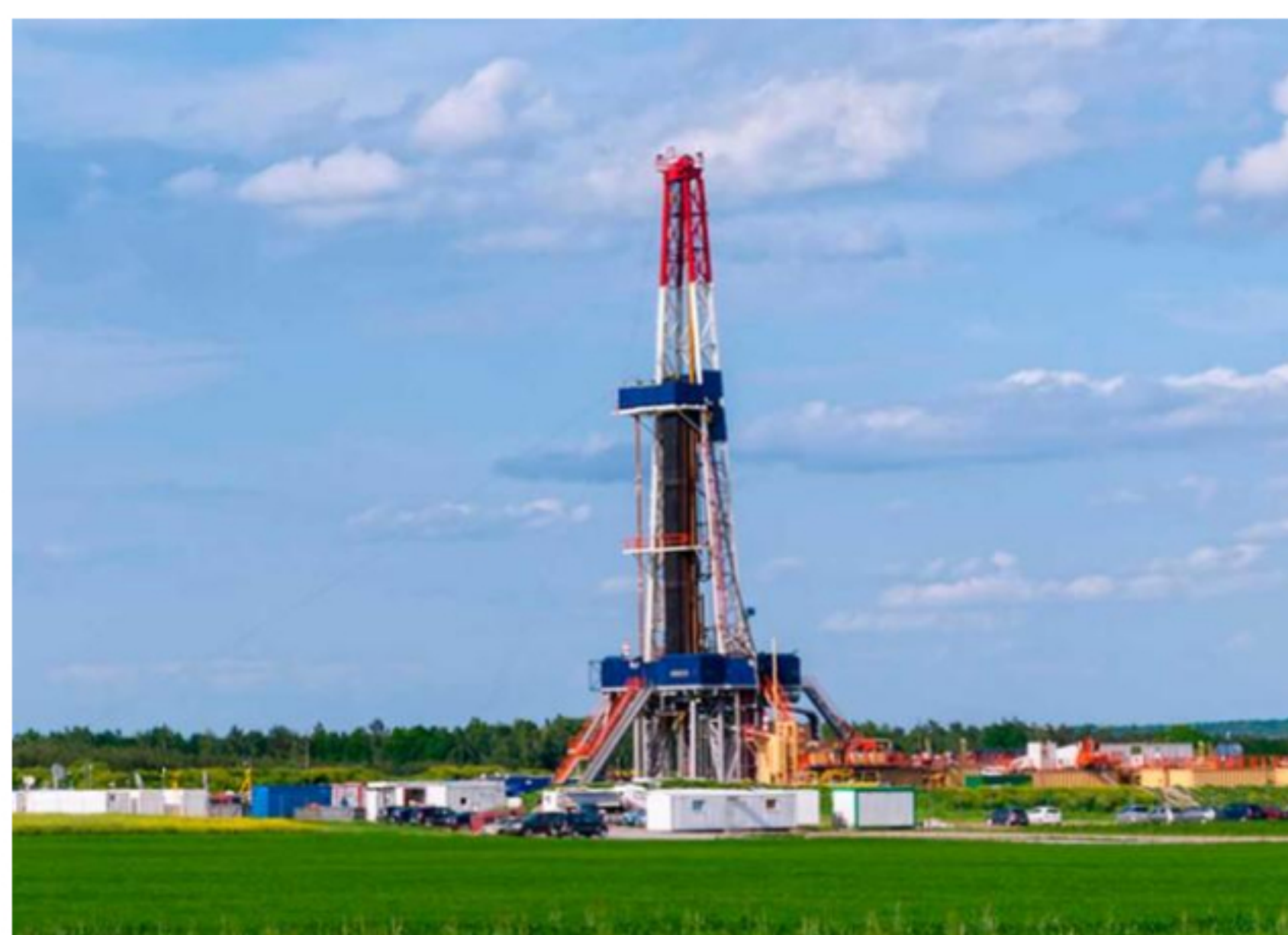
BLU Radio, fracking

Según el presidente el gremio de las petroleras, el año pasado se aplazaron millones de dólares en inversiones en la industria.