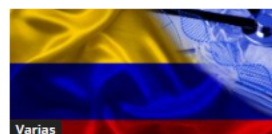
Varias Covid_19: 14.940 nuevo record de contagiados en Colombia