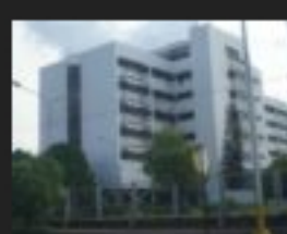
Ecopetrol garantiza servicios a sus beneficiarios pese al sobre cupo en... diciembre 29, 2020