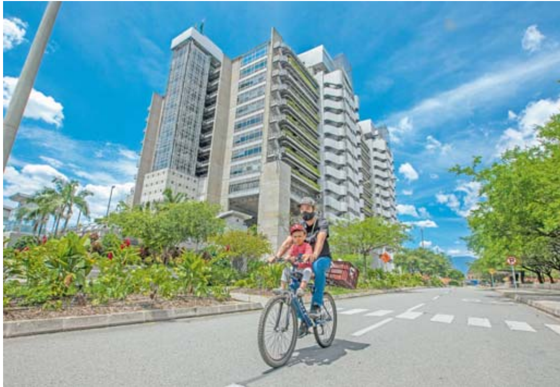
El Grupo EPM y Ecopetrol definieron sus presupuestos y sus planes para 2021, un año en el que el objetivo es superar la coyuntura de la pandemia de la covid-19.

“En un año que será vital para la recuperación económica del país, EPM continuará con el desarrollo del pro-