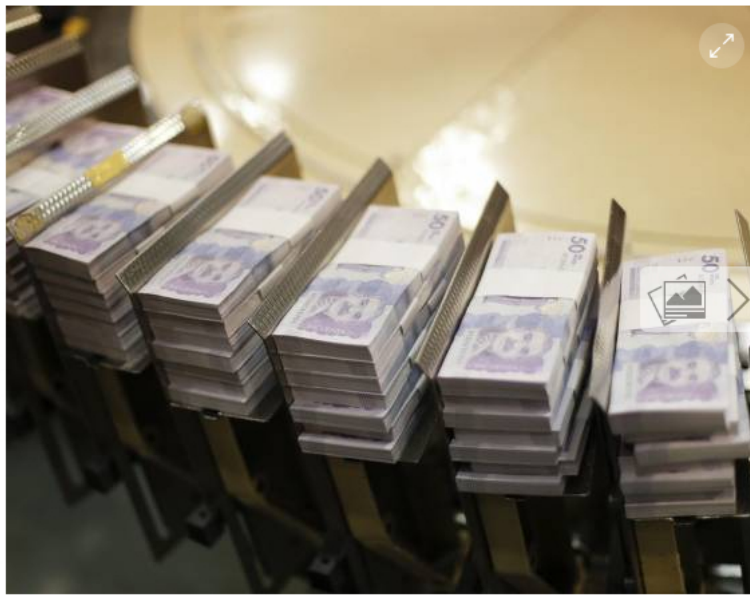
Para el próximo año, lo que se proyectó es un repunte de 5,5 %, lo que también llevaría a que en 2022 se llegue a 3,5 % de alza.

En diciembre, la acción ordinaria de Ecopetrol se ubicó en el primer lugar del ranking, con 41,7 % de las participaciones de los analistas. Le siguen las acciones preferenciales del Grupo Bancolombia con 33,3 % de preferencia, Grupo Aval con 29,2 %, que aunque se mantiene en el ranking reportó una pérdida de preferencia respecto a los números dados en noviembre, Davivienda con 29,2 % y finalmente la acción de Bancolombia que es preferida por 25,0 % de los encuestados.