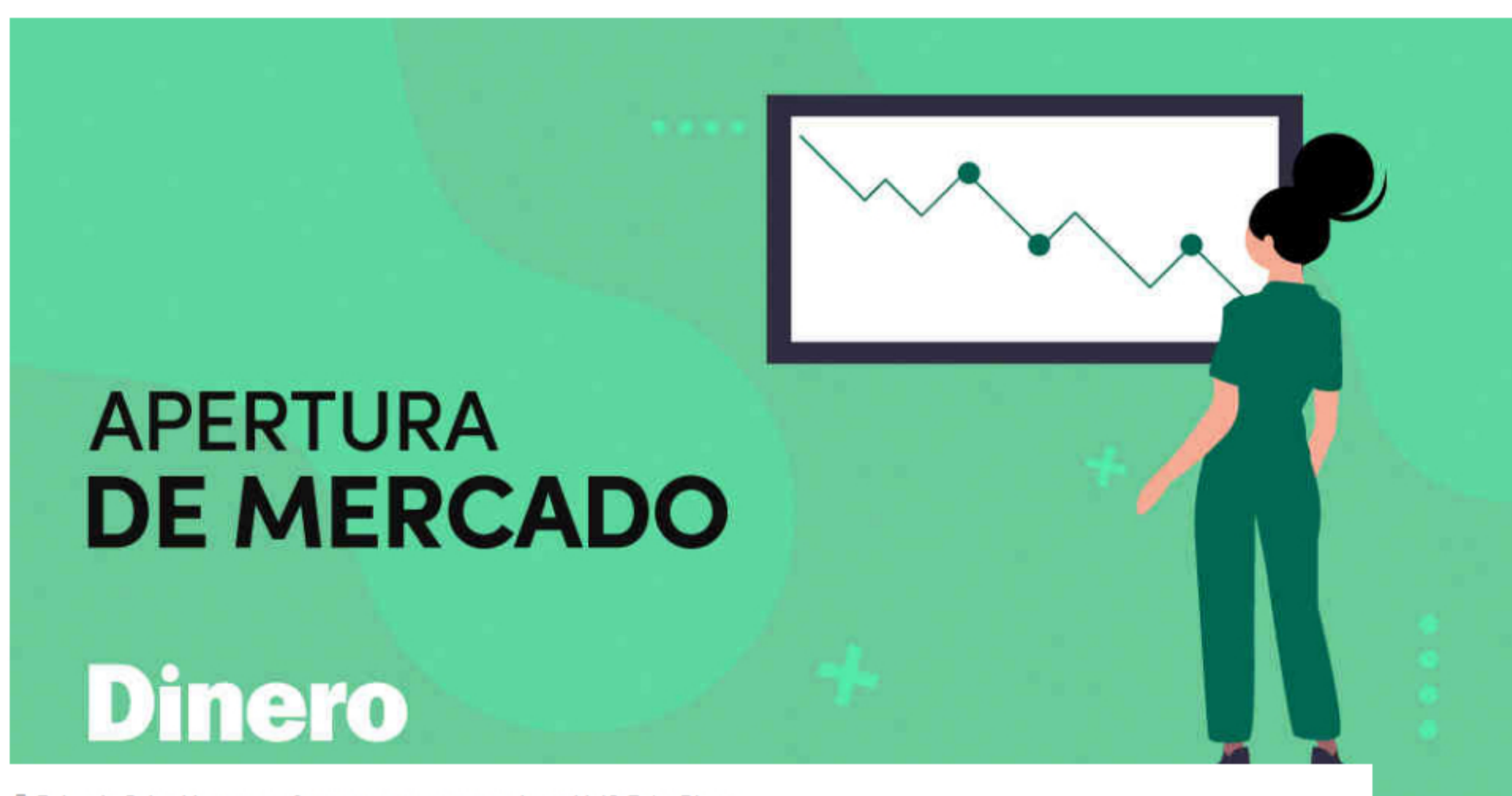
Bolsa de Colombia cae con fuerza ante nueva cepa de covid-19.

El índice Colcap, de la Bolsa de Valores de Colombia cae con fuerza al inicio de la jornada de este lunes y se resta un 2,78%, perdiendo los 1.400 puntos y se cotiza en 1.386,62 unidades. Durante los primeros minutos de jornada la mayoría de acciones del índice se cotizan a la baja, lastrado por Cementos Argos que pierde 7,28% a $5.410, seguida por Preferencial Grupo Sura con -7,04% y Preferencial Cementos Argos con -6,8%. El desplome del mercado bursátil colombiano se da luego de que se descubriera una nueva cepa de covid-19 en Reino Unido y el temor que esto ha generado en el mercado.