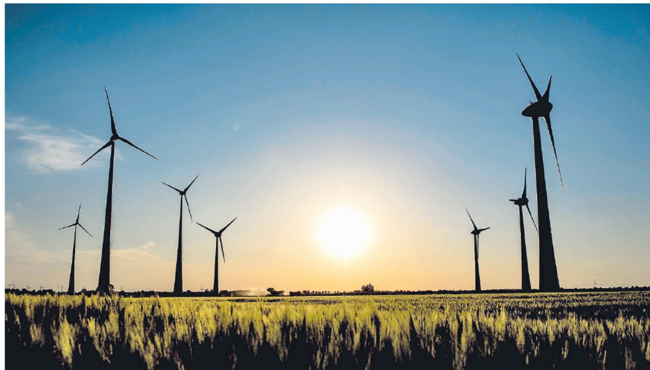
Datos de la Upme indican que hay 294 proyectos en plantas solares, eólicas, pequeñas centrales hidroeléctricas y biomasa.

Así mismo, el jefe de la cartera minero energética, recalcó que el desarrollo del fracturamiento hidráulico ( fracking ), para yacimientos no convencionales (YNC) avanza a paso firme y muestra de ello fue el 2020, año que se caracterizó por dejar sentadas las bases jurídicas, legales, contractuales, sociales y ambientales para que los Proyectos Piloto de Investigación Integral (PPII) en el Magdalena Medio comiencen con pie derecho en el 2021.