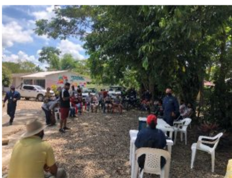
La comunidad acompañó a la Fiscalía y a Cormacarena.

« Ecopetrol reitera que no fue debidamente notificada de la decisión que soporta la medida adoptada por la Corporación», explicó la empresa mediante un comunicado. La inmediata aplicación de la medida afectará la operación de 123 pozos cuya producción asciende a 17.000 barriles por día del Campo Castilla, con las repercusiones que ello trae consigo sobre los recursos que deriva la actividad, para el desarrollo económico de este importante centro de producción de hidrocarburos del país», señaló la empresa de hidrocarburos mediante un comunicado.