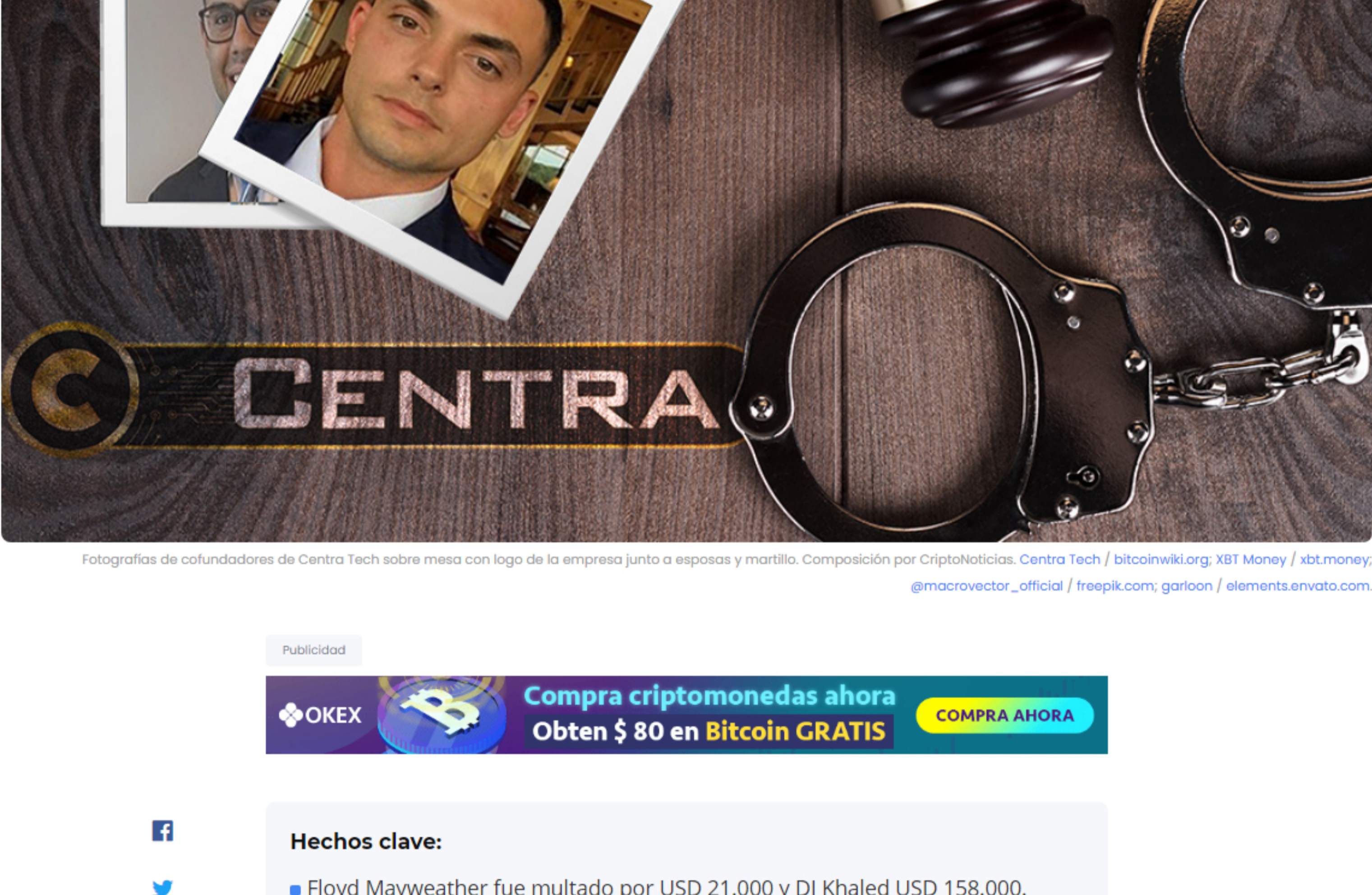
Fotografías de cofundadores de Centra Tech sobre mesa con logo de la empresa junto a esposas y martillo. Composición por Criptonoticias. Centra Tech / bitcoinwiki.org ; XBT Money / vixt.money ; macrovector_official / freepik.com ; garoon / elements.envato.com

Por Redacción — 17 diciembre, 2020 en Judicial 2 min de lectura