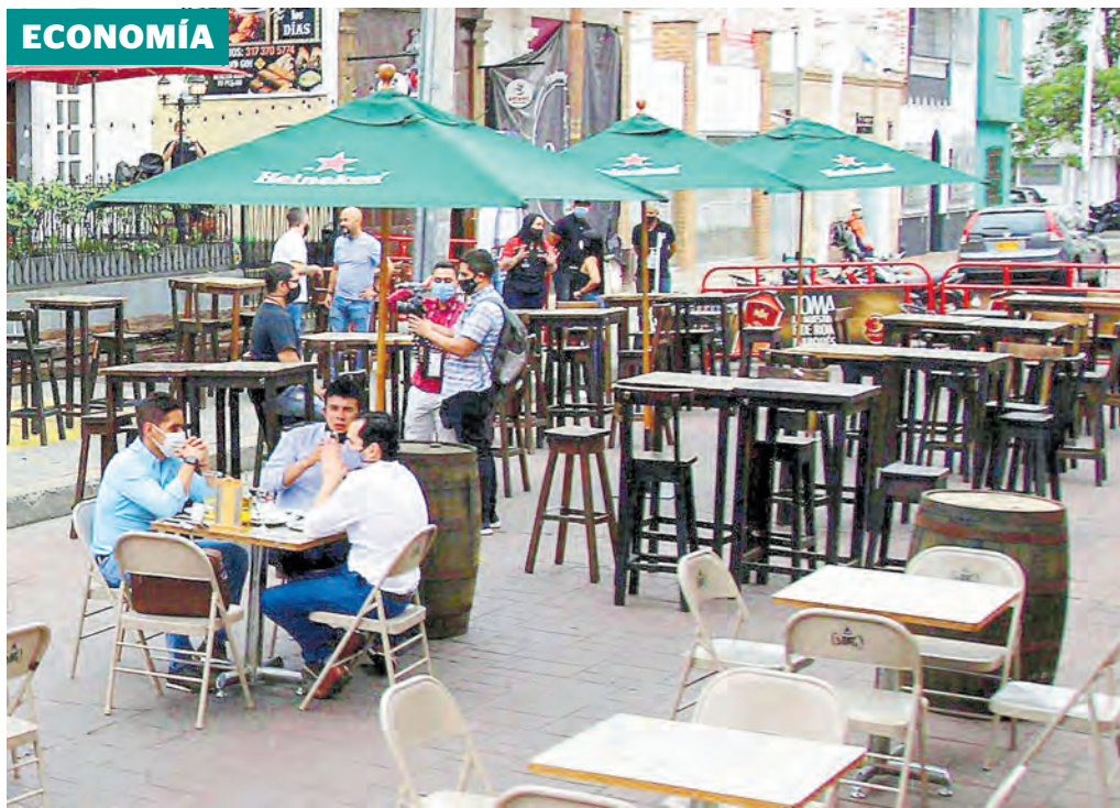
Varias de las principales ciudades prohibieron la venta de alcohol después de las 10:00 p.m. CEET

El año que termina marca un antes y un después en los principales indicadores económicos y sociales del país, por culpa de pandemia. Pese a ello, hay expectativas de que la recuperación se consolide en 2021. Pág. 7