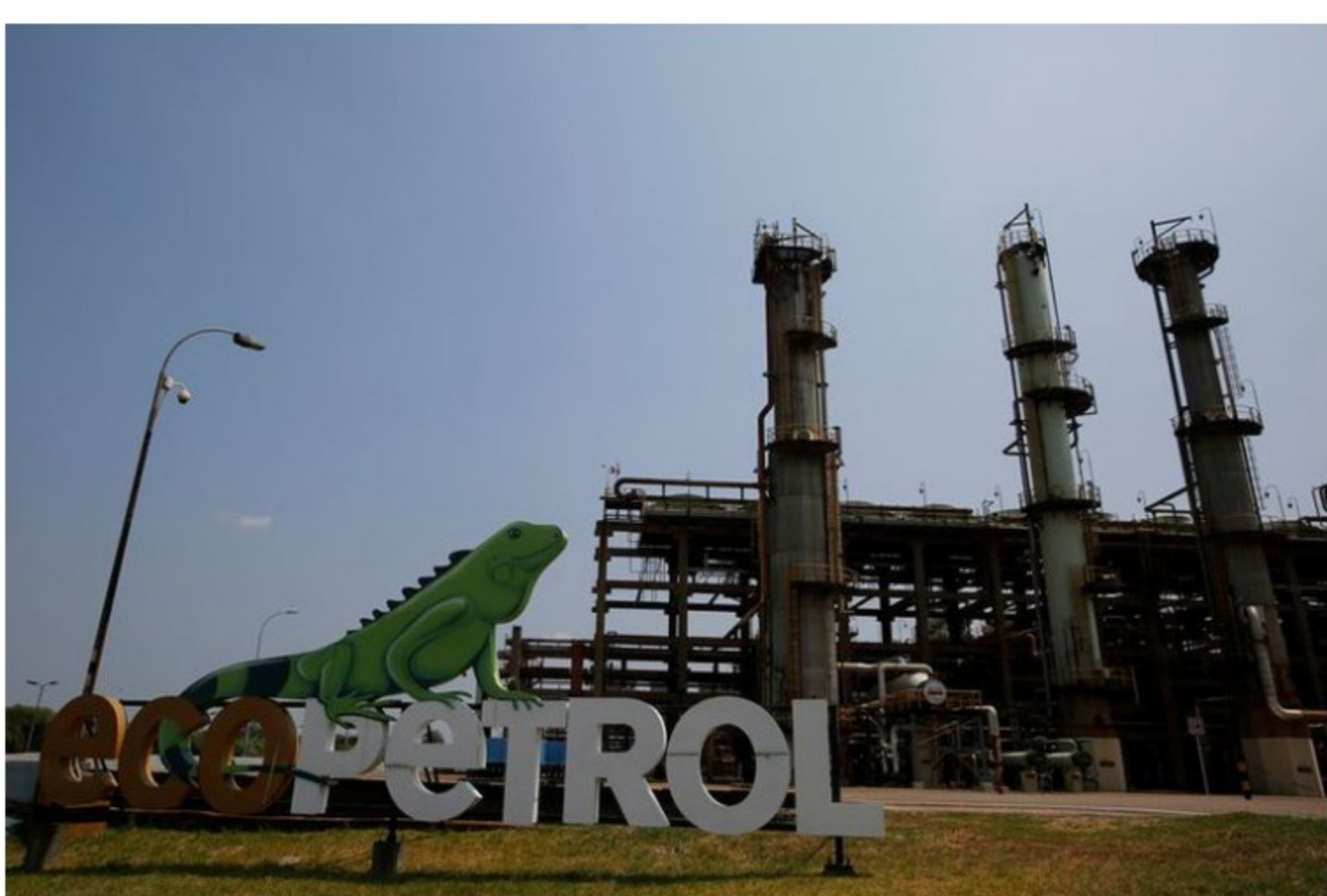
Imagen de archivo de la refinería de petróleo de Ecopetrol en Barrancabermeja, Colombia, Marzo 1, 2017.