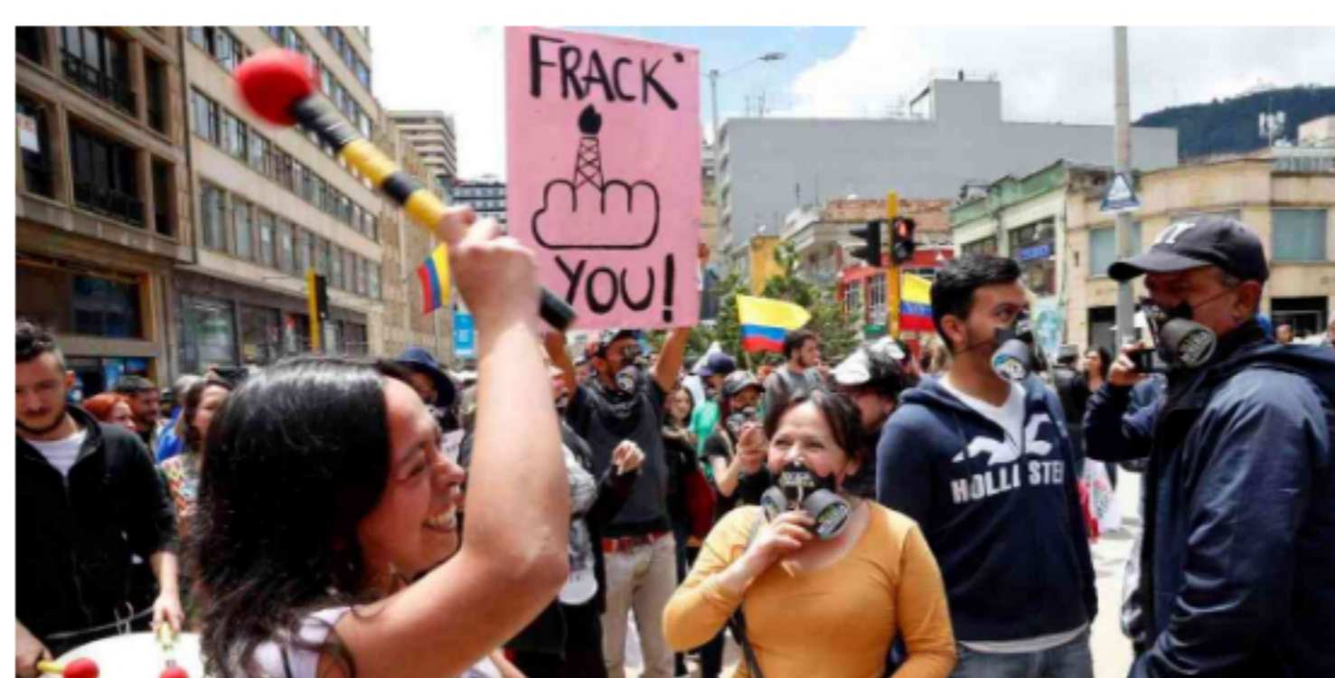
En el país se han realizado varias manifestaciones en contra de la implementación del fracking.

El líder ambiental destacó el hecho de que esta sería una acción simbólica relevante, teniendo en cuenta que sería la primera gran acción de movilización en el epicentro de los proyectos pilotos de fracking.