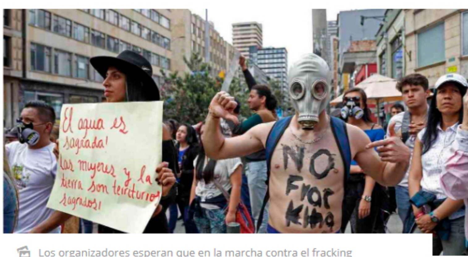
Los organizadores esperan que en la marcha contra el fracking en Puerto Wilches (Santander), se realice cerca de 4.000 personas. Foto: Mauricio Ochoa Suárez / Semana. Foto: Mauricio Ochoa