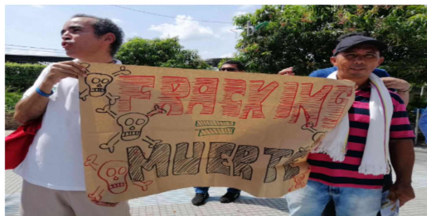
La organización le solicitó a las personas que fueran a participar en la marcha, llevar tapabocas, alcohol y gel antibacterial.

Para el domingo, entre tanto, se tiene programada la realización de la Marcha-carnaval por el Agua, la Vida y el Territorio. La actividad partirá del Parque Infantil, desde las 8:00 de la mañana.