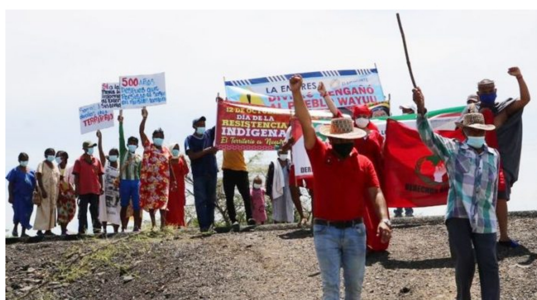
Aspecto de los integrantes de la ONG Gran Nación Wayuu en una de sus actividades en La Guajira.