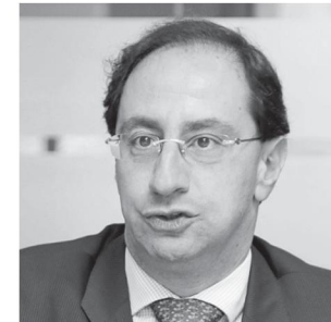
José Manuel Restrepo, ministro de Comercio e Industria.

Lanzan cuatro acciones para atraer más inversión al país