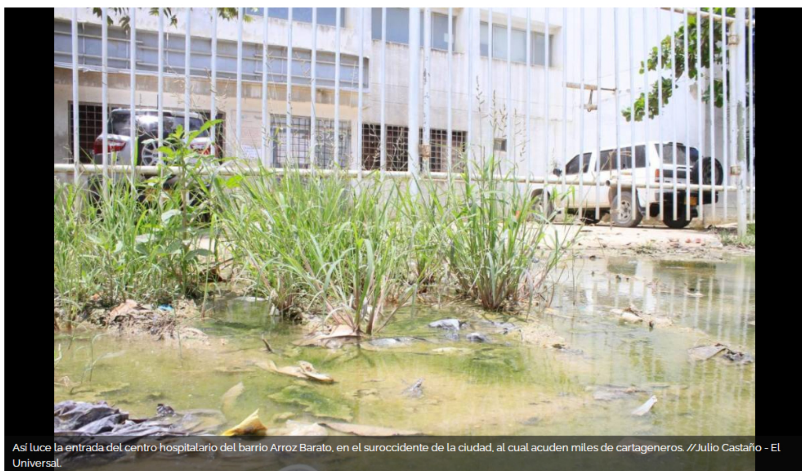
Así luce la entrada del centro hospitalario del barrio Arroz Barato, en el suroccidente de la ciudad, al cual acuden miles de cartageneros.

Líderes comunales y vecinos piden intervención para este centro hospitalario, porque en la entrada tiene aguas empozadas, basureros y su fachada está deteriorada.