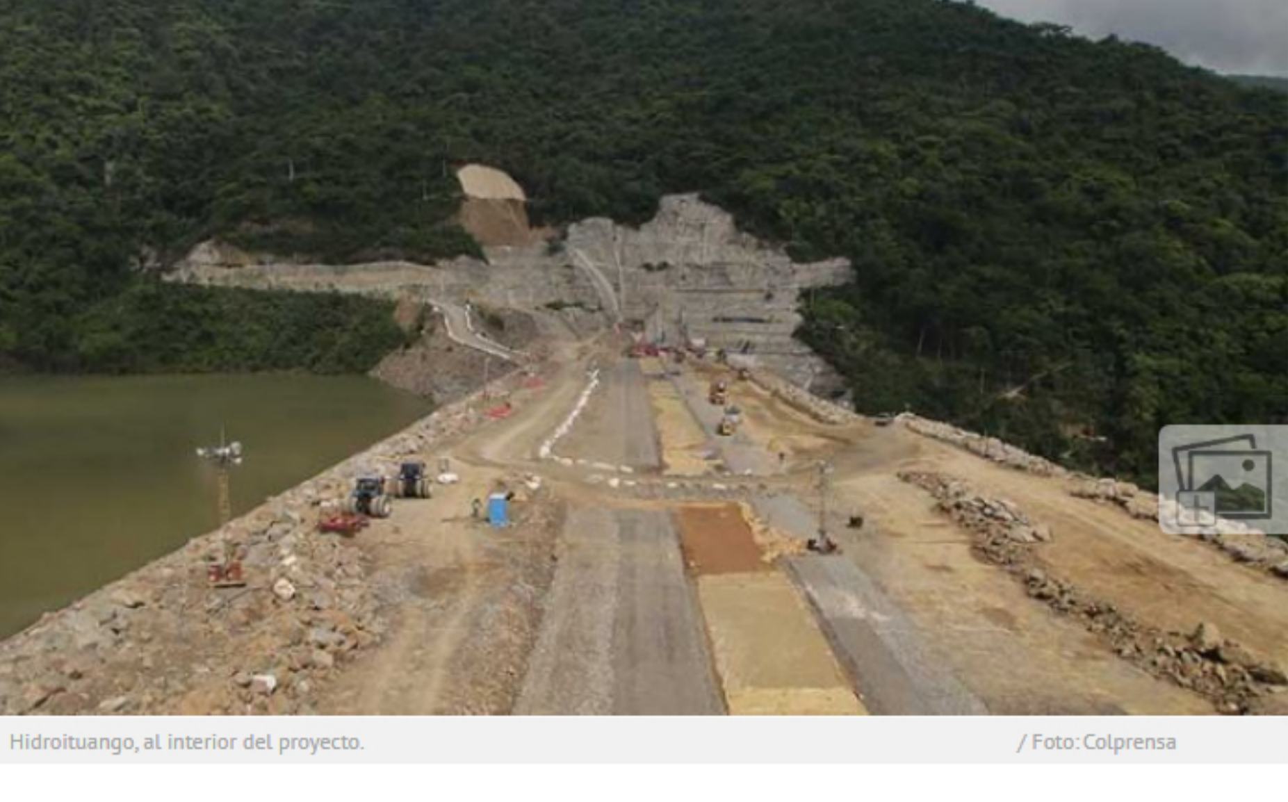
Hidroituango, al interior del proyecto.

El tema es de tal interés que en el Senado de la República ya se empezó a debatir sobre el mismo.