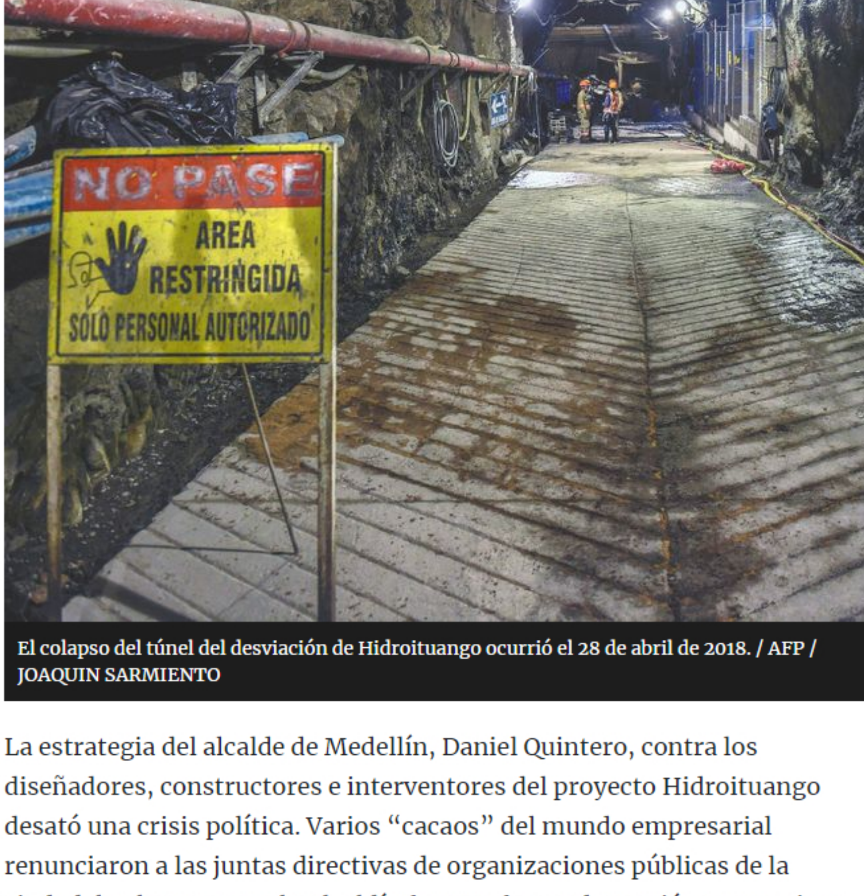
El colapso del túnel del desviación de Hidroituango ocurrió el 28 de abril de 2018.