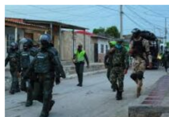
Toque de queda y ley seca durante este puente festivo