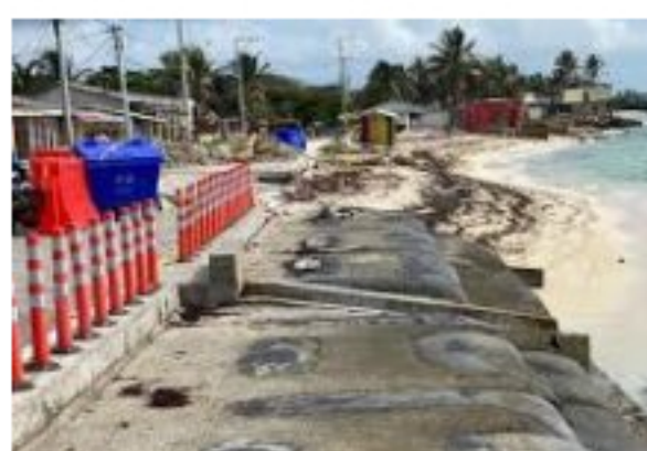
Recuperación de transitabilidad en la avenida Circunvalación de la isla de San Andrés inicia INVÍAS