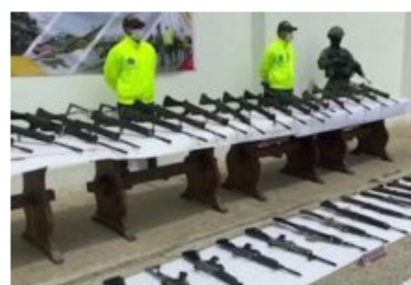
Golpe a 'Los Rastrojos' tras incautación de material de guerra