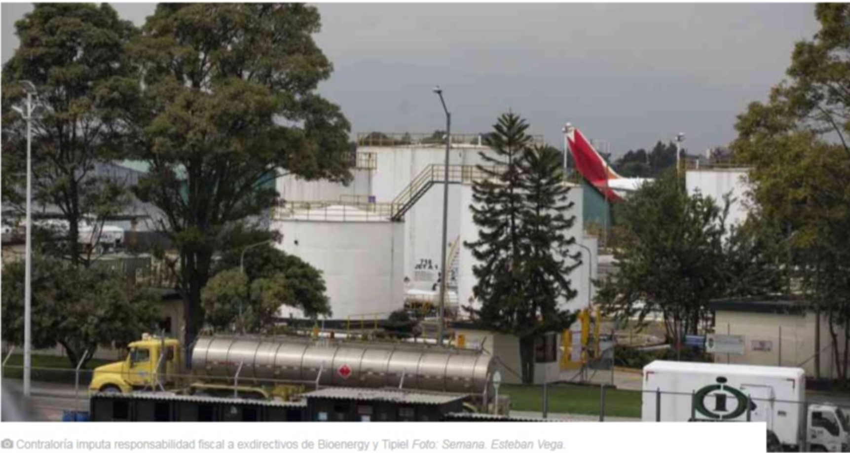
Contraloría imputa responsabilidad fiscal a exdirectivos de Bioenergy y Tipiel

La Contraloría General de la República imputó responsabilidad fiscal por $12.200 millones a dos exdirectivos de Bioenergy (filial de Ecopetrol ) y a la firma Tipiel S.A. por corrección en los diseños de una planta de etanol en el Meta que habían sido certificados como realizados.