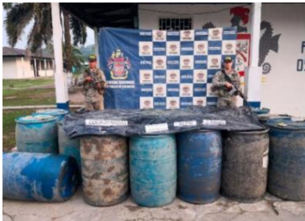
Ecopetrol denunció que en lo que va del 2020 les han robado 11 camionetas

Crudo Transparente informó que se decomisaron en total 4.358 galones (16.299 litros) de combustible entre gasolina y ACPM (diesel) en Norte de Santander, Nariño, Magdalena y Putumayo, en el marco de las acciones de contrabando. Cifra que representa un descenso de 91,16% con respecto a los 49.339 (184.528 litros) galones incautados en junio de 2020, mes del año en el cual, hasta ahora, se ha incautado más gasolina de contrabando.