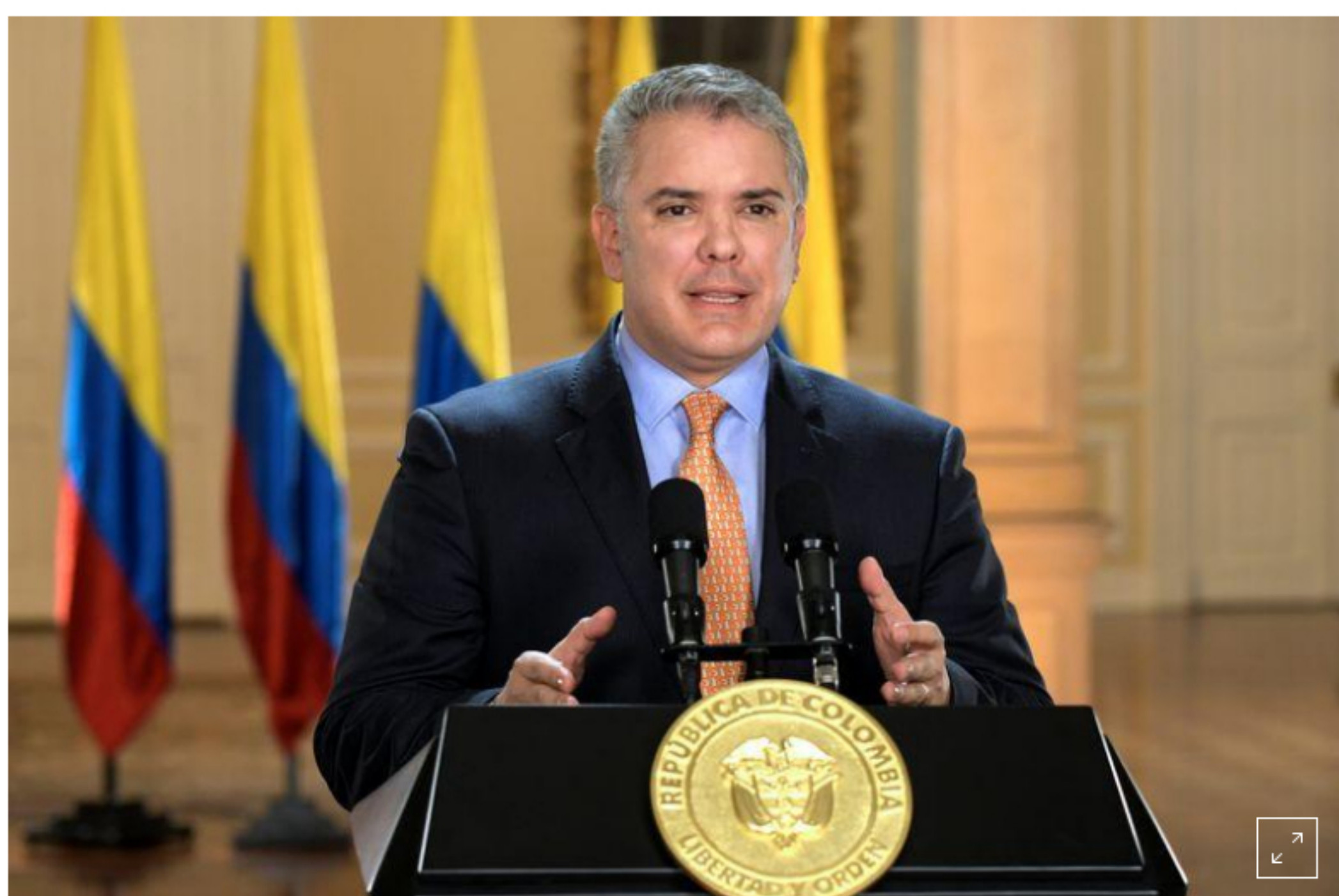
Foto de archivo. El presidente de Colombia, Iván Duque, se dirige a la nación en un discurso televisado desde el palacio presidencial en Bogotá, Colombia, 17 de marzo, 2020. ATENCIÓN EDITORES ESTA IMAGEN FUE SUMINISTRADA POR UN TERCERO

BOGOTÁ, 6 ago (Reuters) - Colombia analiza la posibilidad de vender activos no estratégicos y de baja rentabilidad para incrementar la inversión social e impulsar el desarrollo del país, pero una decisión sobre enajenar parte de Ecopetrol la deberá tomar su junta directiva, dijo el jueves el presidente Iván Duque.