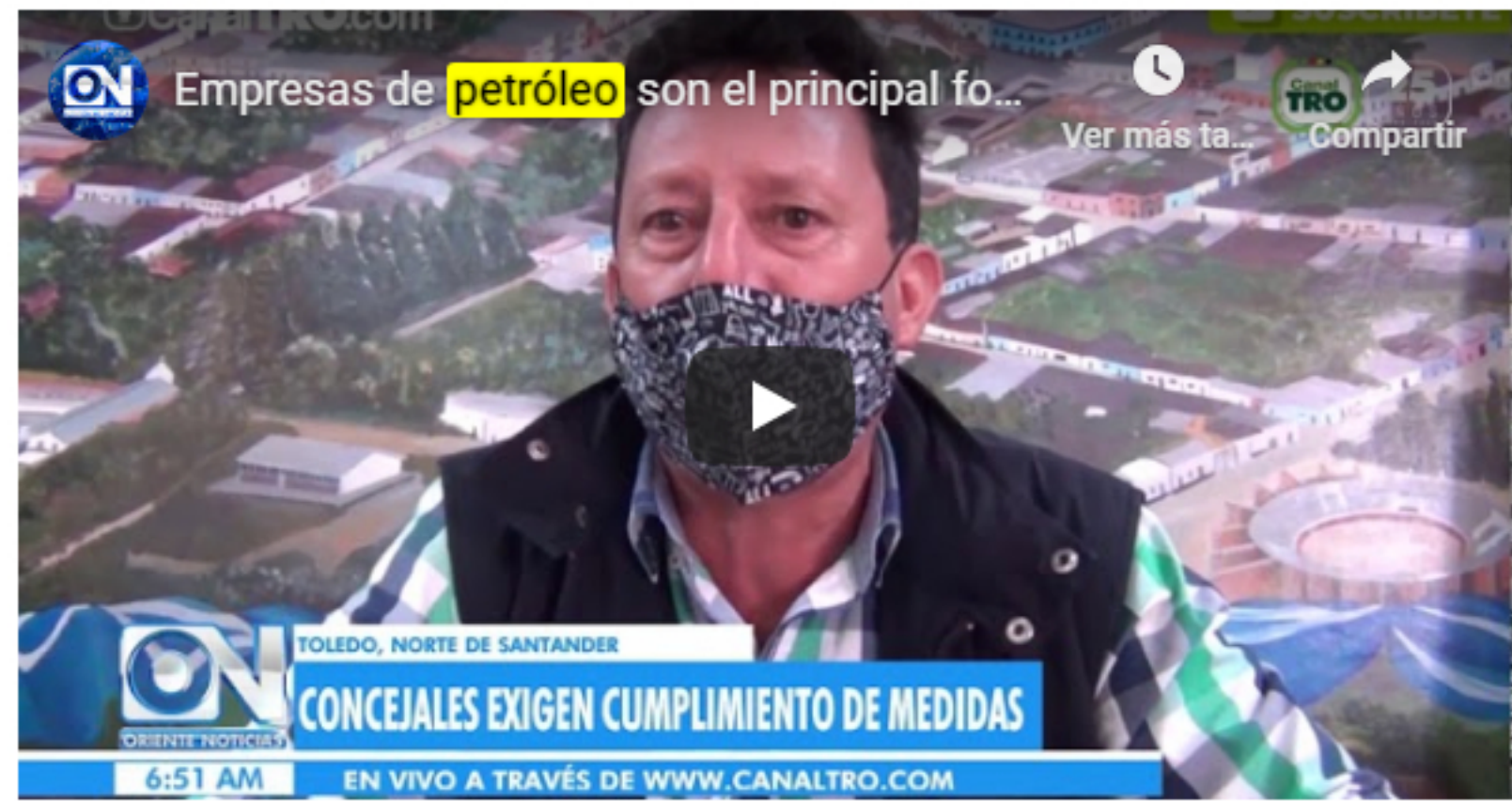
Lea también: Santanderes lideran tutela para proteger el páramo de Santurbán

Lea también: En el 80% de los municipios de Norte de Santander ya habita el COVID-19