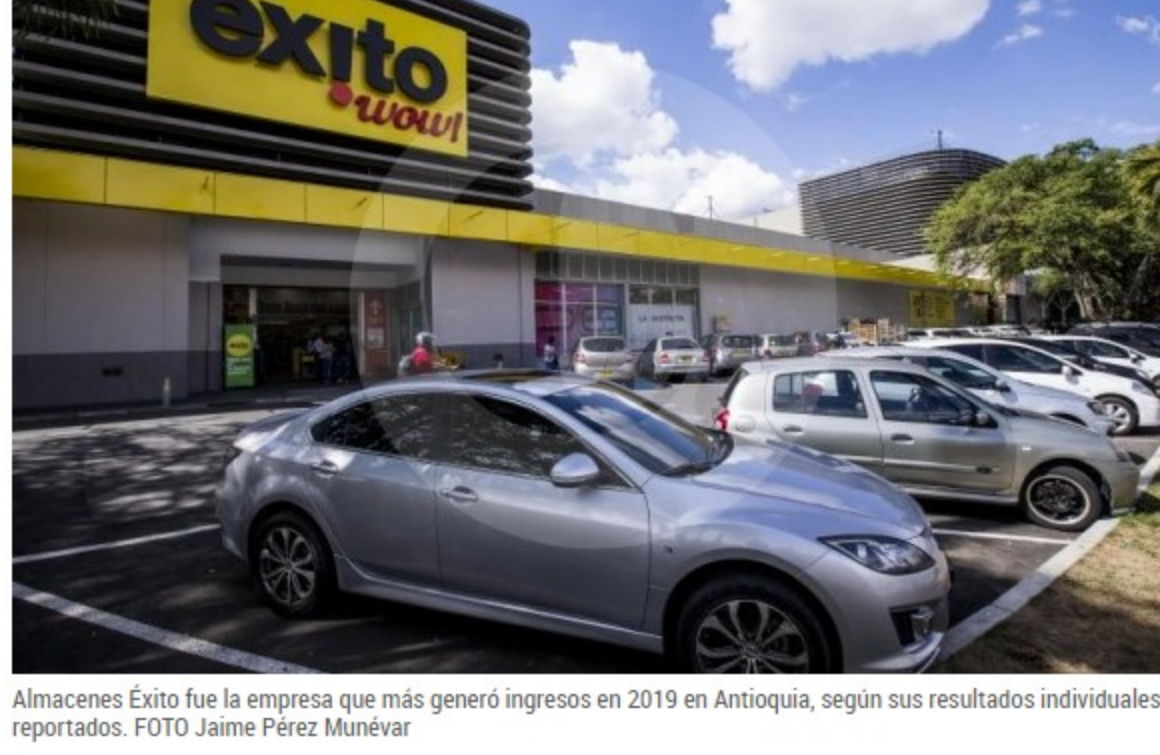
Almacenes Éxito fue la empresa que más generó ingresos en 2019 en Antioquia, según sus resultados individuales reportados.

COLOMBIA | EMPRESAS | EMPRESAS ANTIOQUEÑAS