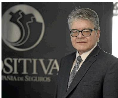
Positiva Compañía de Seguros