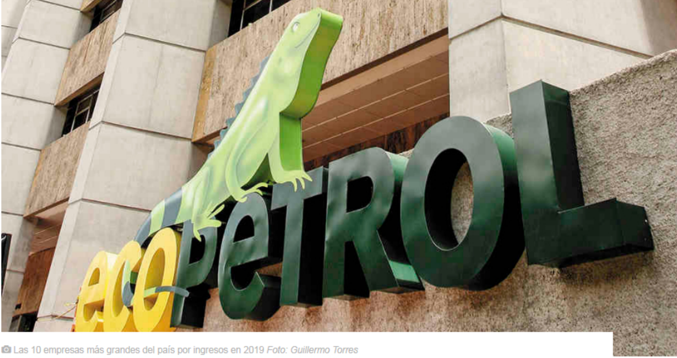
Las 10 empresas más grandes del país por ingresos en 2019

La Superintendencia de Sociedades presentó el informe de las 1.000 empresas más grandes del país, que, por ingresos operacionales en 2019, lideró nuevamente Ecopetrol , seguida por Terpel, Reficar , Claro y Grupo Éxito.