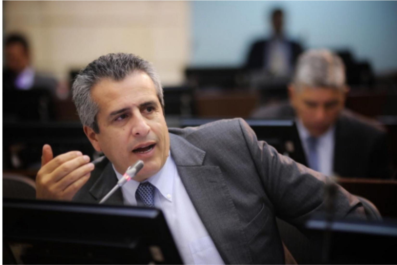
Luis Fernando Velasco, senador de la República

El Senador liberal Luis Fernando Velasco, junto con un grupo de congresistas de distintas bancadas, radicó un proyecto de ley que busca derogar el Decreto 811 de 2020, según él, "porque el Gobierno se auto habilita para privatizar las empresas estatales sin ningún tipo de control".