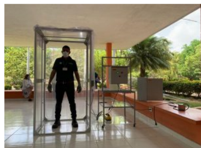
Esta es la cabina que fue diseñada por los instructores y aprendices del Sena La Guajira.

Asimismo se conoció que la cabina trabaja con energía solar y comenzó a operar al interior de este centro asistencial, para proteger la vida de unos 350 profesionales de la salud. La cabina desinfecta: overoles, tapabocas y se alistan para la impresión de caretas en 3D.