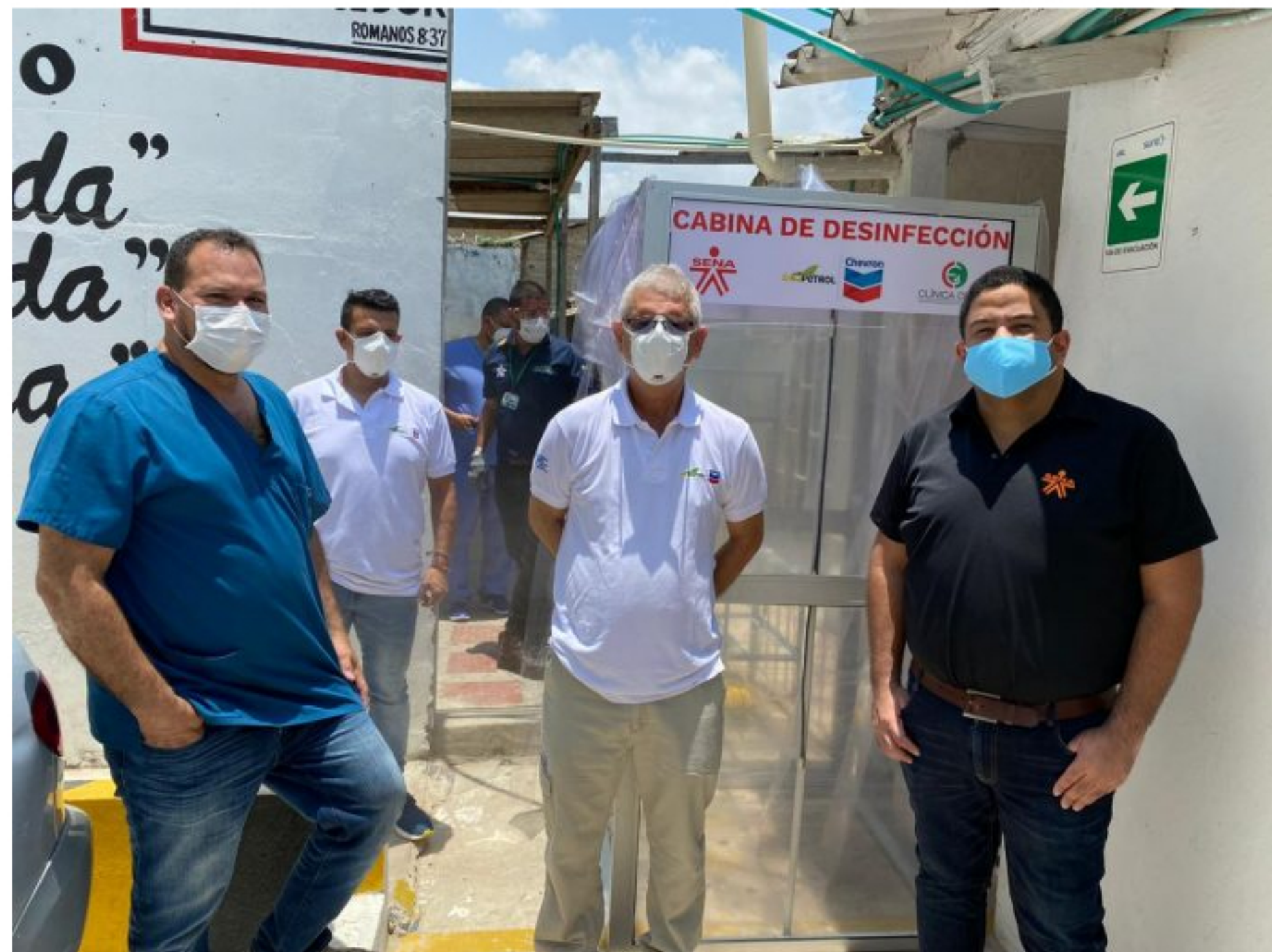
La cabina desinfectante se encuentra ubicada dentro del centro asistencial en Riohacha.

Gracias a la alianza de la Asociación Ecopetrol – Chevron y la clínica Cedes, quienes aportaron los recursos necesarios para que instructores y aprendices del Sena, elaboraran una cabina desinfectante.