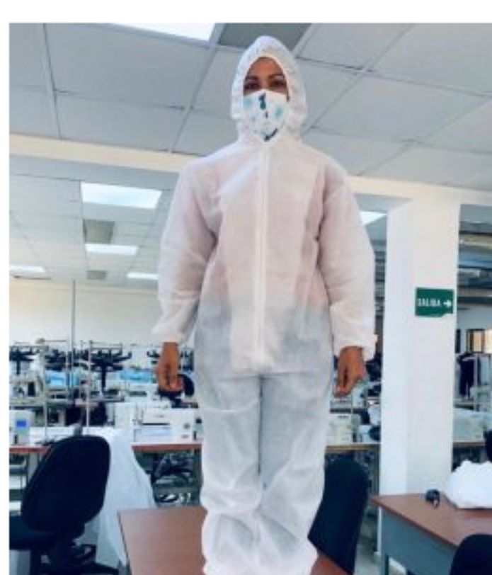
Instructores y aprendices del programa de confección del Sena en Maicao trabajan en dotación de 350 overoles y 1.000 tapabocas, para proteger el personal médico de la clínica.

El médico Salomón Quintero, coordinador de Urgencias de la Clínica Cedes, agradeció el apoyo en la elaboración de estos materiales de protección personal de todo el equipo médico, “esta es la base fundamental para la atención de los pacientes con Covid-19 o pacientes asintomáticos respiratorios que llegan al servicio de urgencias y que vayan a ser tratados en la UCI y hospitalización”.