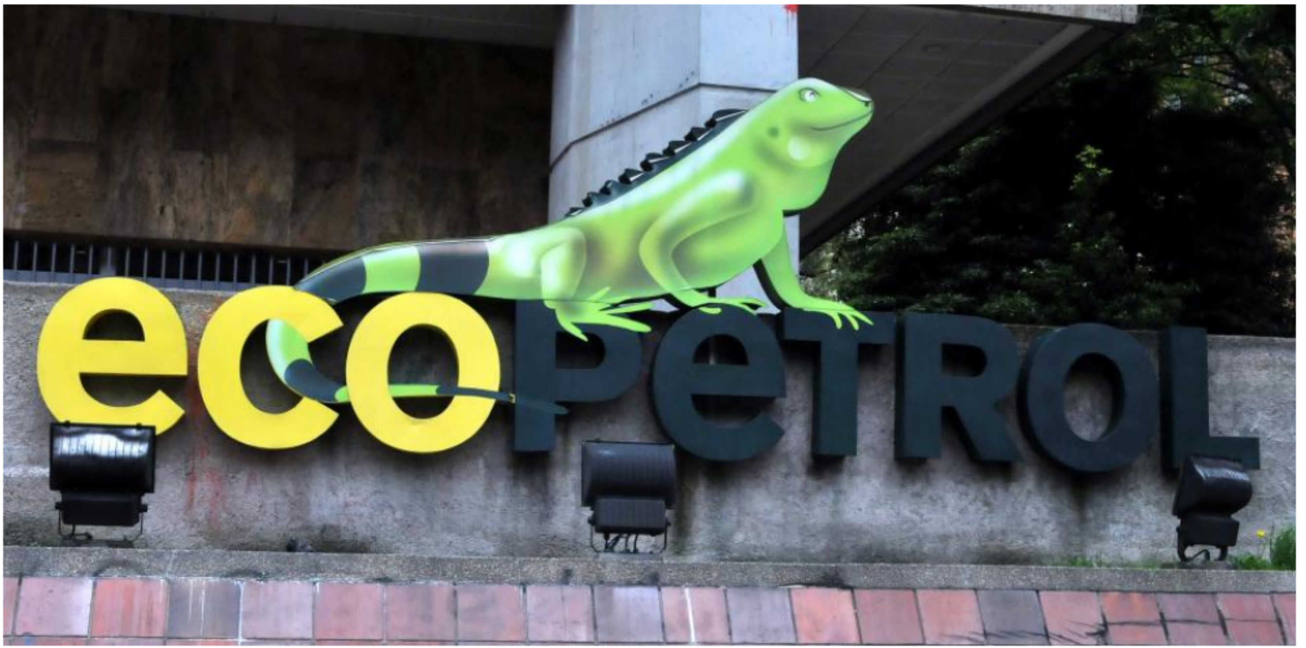
La petrolera señaló que la guerra petrolera y la drástica caída de la demanda de crudo llevaron a que sus estimaciones de su utilidad bruta consolidada bajará.

RELACIONADOS: PETRÓLEO EN COLOMBIA | ECOPETROL | PRECIO DEL PETRÓLEO | CORONAVIRUS EN COLOMBIA