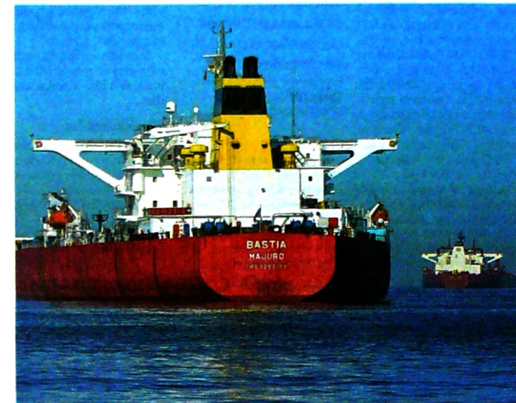
Barcos actúan hoy como almacenamiento flotante de petróleo en Long Beach, EE. UU.

El Golfo es una arteria importante para la exportación de crudo hacia los mercados mundiales, y cualquier tensión tiene impacto alcista sobre el petróleo. Para sostener los precios,