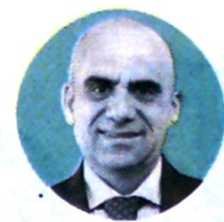
Carlos Álvarez, epidemiólogo consultor de la OMS.

Se han realizado desembolsos por $140.000 millones en crédito a pequeños y medianos productores agropecuarios. Hay aprobados $95.000 millones.