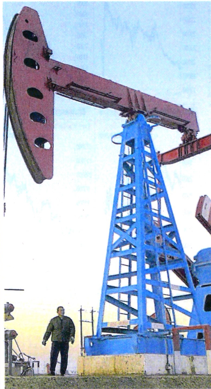
Muchas empresas han tenido que bajar producción.

Cabe decir que Venezuela, que llegó a superar hace años los 3,5 millones de barriles diarios, al cierre de marzo reportó una producción de 660.000 millones de barriles, un indicador