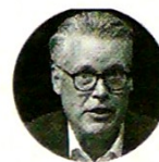
Ed Bastian Director ejecutivo de Delta Air Lines

Una de las grandes preocupaciones de los inversionistas es si la empresa mantendrá en pie sus compromisos con sus socios internacionales.