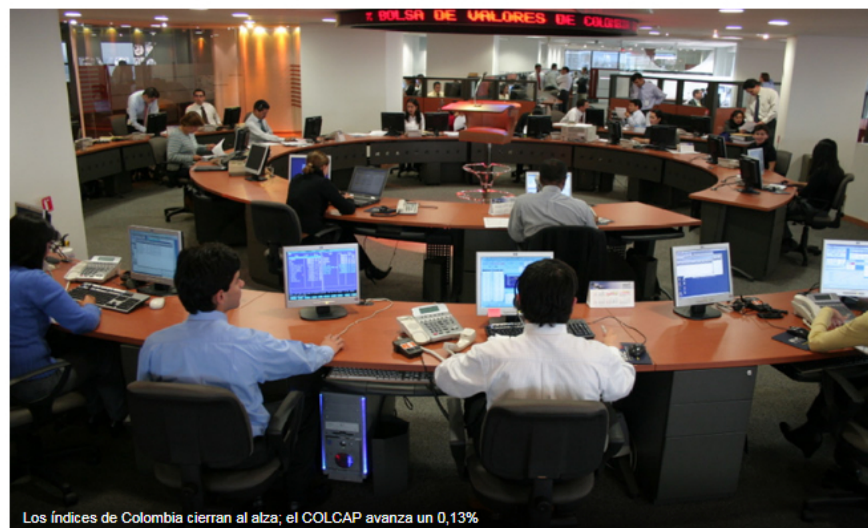
Los índices de Colombia cierran al alza; el COLCAP avanza un 0,13%

Investing.com – La Bolsa de Colombia cerró con avances este miércoles; las ganancias de los sectores agricultura , COL Inversionist , y servicios públicos impulsaron a los índices al alza.