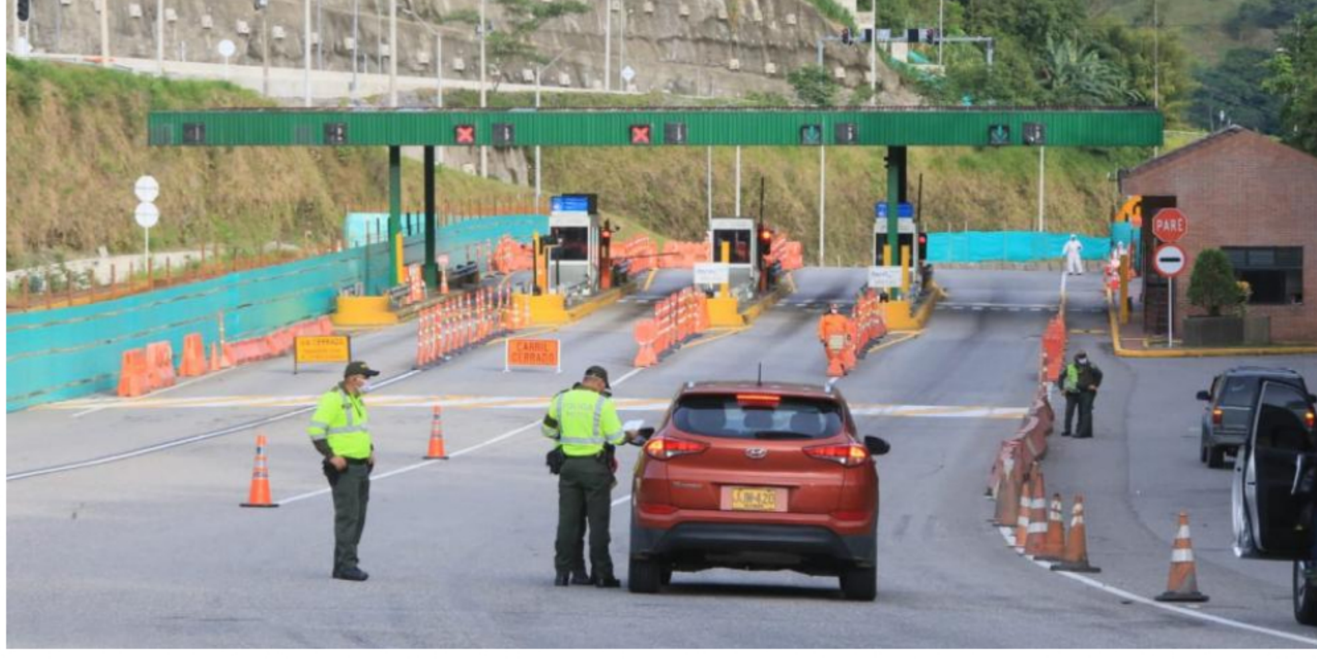
La vía al Llano fue cerrada para evitar la propagación del virus.