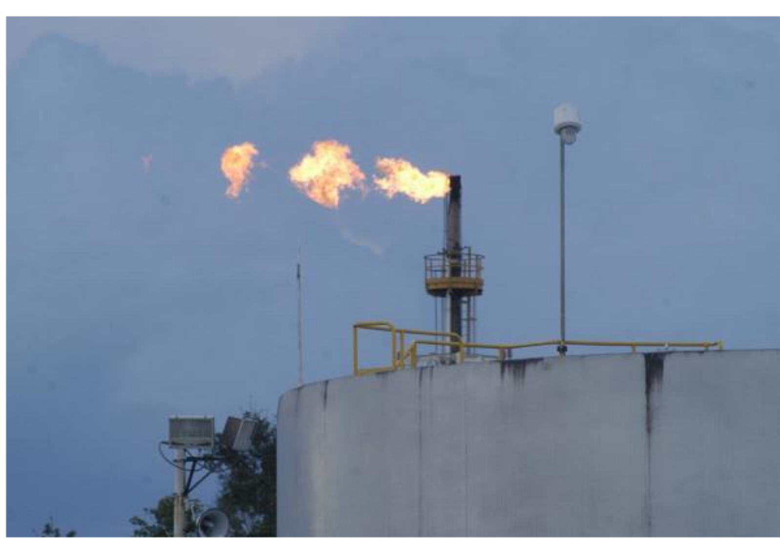
Van más de 5.000 despidos en la industria petrolera del Meta.

La caída de los precios del petróleo también empieza a repercutir, puesto que es una de las principales fuentes económicas de la región. Ecopetrol acababa de abrir un nuevo campo a seis años, cuando regularmente lo hacía a dos y tres años.