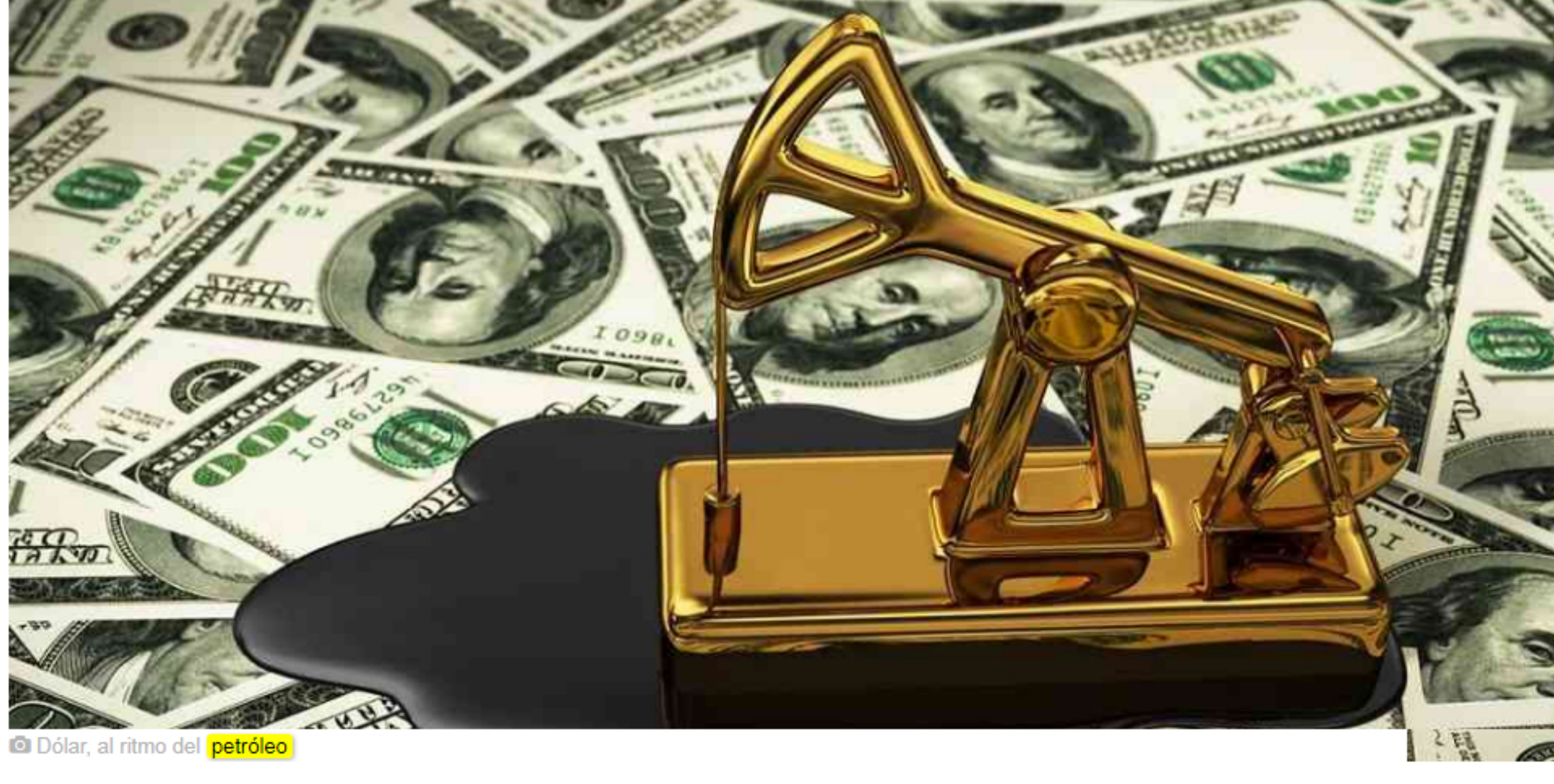
© Dólar, al ritmo del petróleo

Ante las buenas noticias internacionales y una valorización de los índices accionarios globales, las materias primas y los activos de mercados emergentes, el peso colombiano tuvo una ligera variación y cerró en $4.031