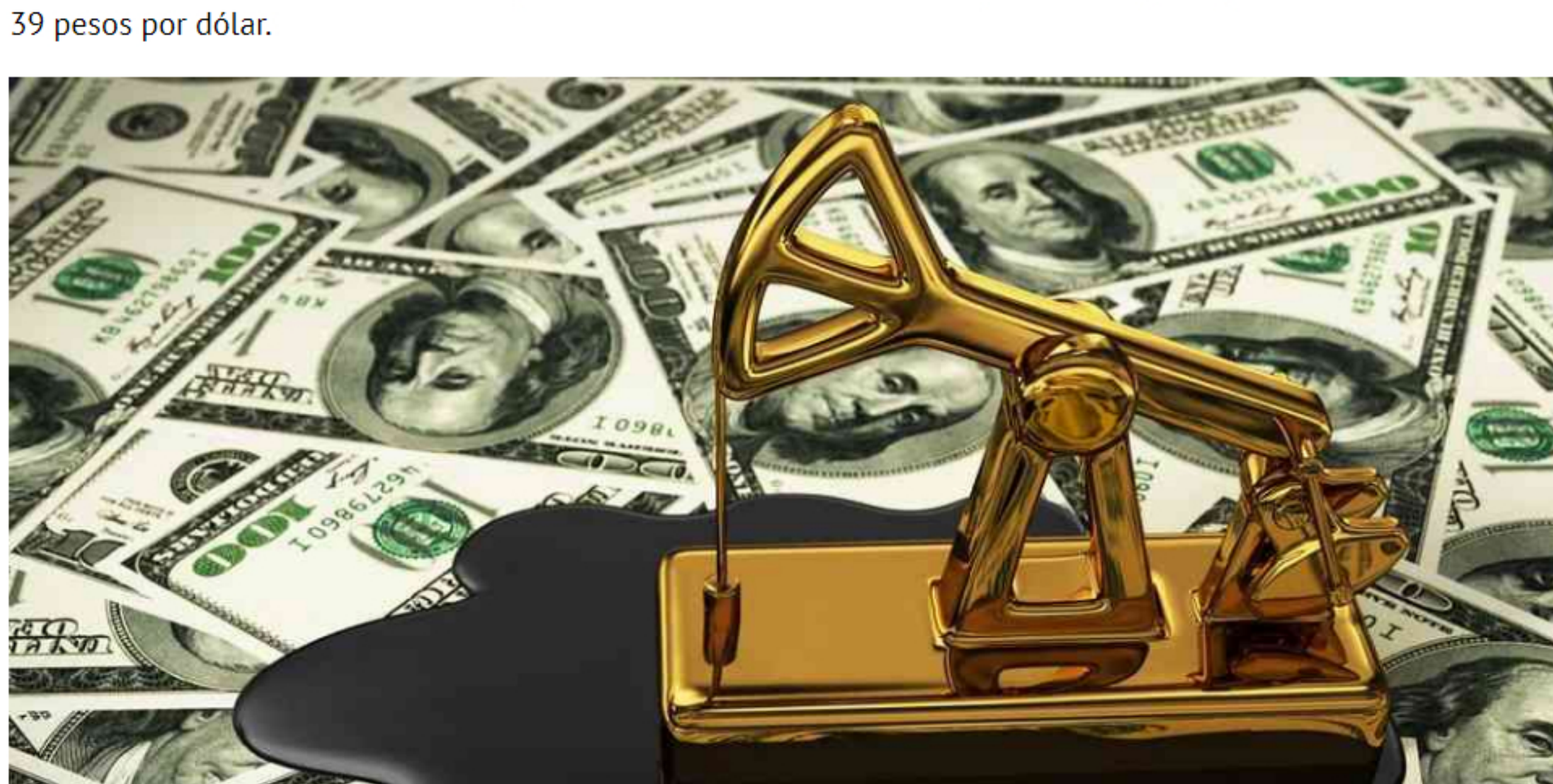
© Petróleo regalado: ¿cuál es el impacto sobre el precio del dólar?

El precio del petróleo WTI terminó en terreno negativo por primera vez en la historia. Con esto, el peso colombiano se devaluó cerca de 1% y se ubicó en $3.976 al final de la jornada, lo que representa una subida de 39 pesos por dólar .