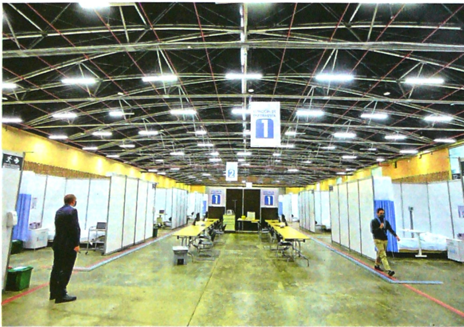
Ayer se cumplió formalmente la entrega de las primeras 200 camas del hospital en Corferias.

La Secretaría de Integración Social refuerza la protección de funcionarios con 1.200 kits, que incluyen trajes, guantes y tapabocas. Para esta dotación se dispusieron 161 millones de pesos.