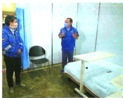
Claudia López y su secretario de Salud recorrieron el centro hospitalario en Corferias.

Aunque el Distrito adquirió 400.000 pruebas, solo puede procesar máximo 2.000 por día en los tres centros autorizados hasta el momento. Ante el Concejo, donde presentó un balance de la emergencia, también dijo que otros seis centros están a la espera para ser acreditados y agilizar los procesos de las muestras.